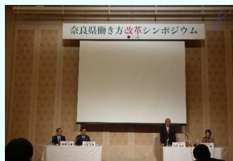
働き方改革シンポジウム