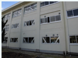
<耐震工事を実施した校舎>