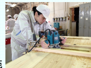
職業訓練の実施風景