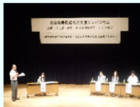
社会復帰促進就労支援シンポジウム