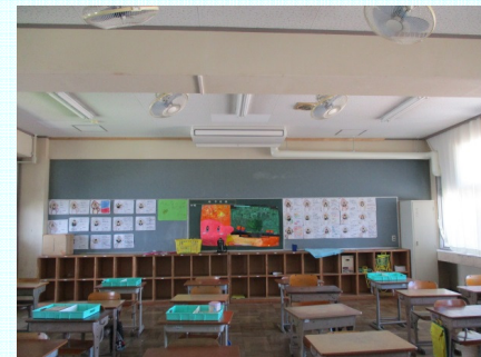
<空調設備が設置された教室>

平成30年度国補正予算（第1号）に計上された「ブロック塀・冷房設備対応臨時特例交付金」を活用して公立小中学校普通教室への空調設備の設置に取り組む市町村に対し、緊急的な財政支援を実施