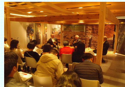
首都圏における県産材PRイベント