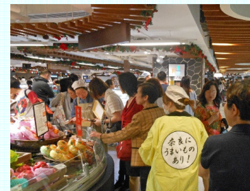
香港高級スーパー試食会