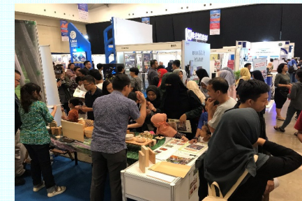
海外での県産材のPR・マッチング(インドネシア)