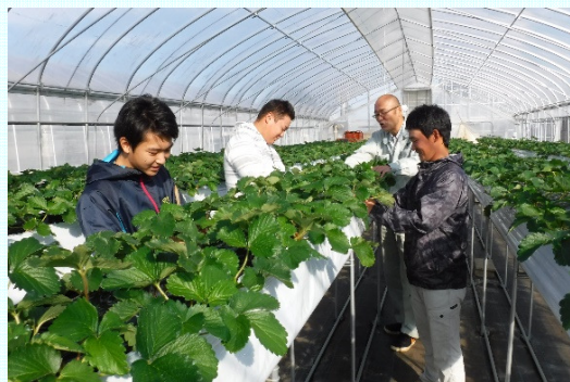
新規参入者の農家実践研修