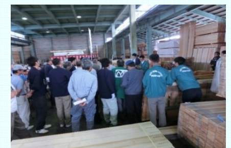
木材市場での県産材のPR(高岡木材市場)