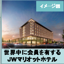
世界中に会員を有するJWマリオットホテル