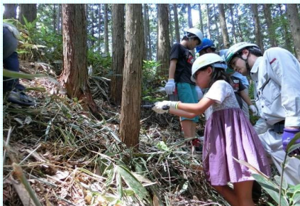
子どもたちによる間伐体験