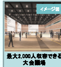
最大2,000人収容できる大会議場