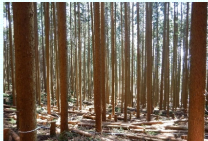
整備された施業放置林