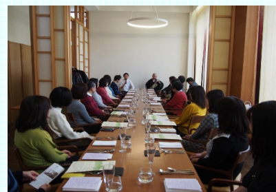
魅力発信イベント