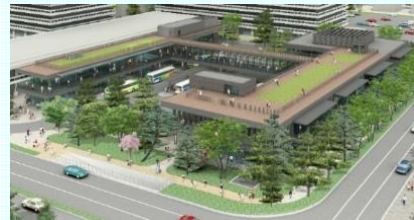
バスターミナルの整備後のイメージ