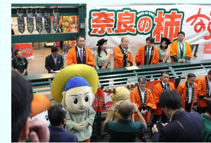
知事トップセールス