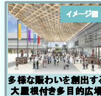
多様な賑わいを創出する大屋根付き多目的広場