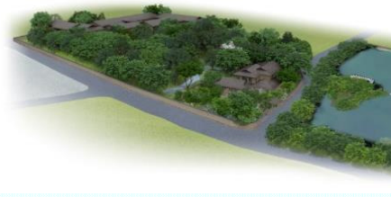
高畑町裁判所跡地整備後のイメージ