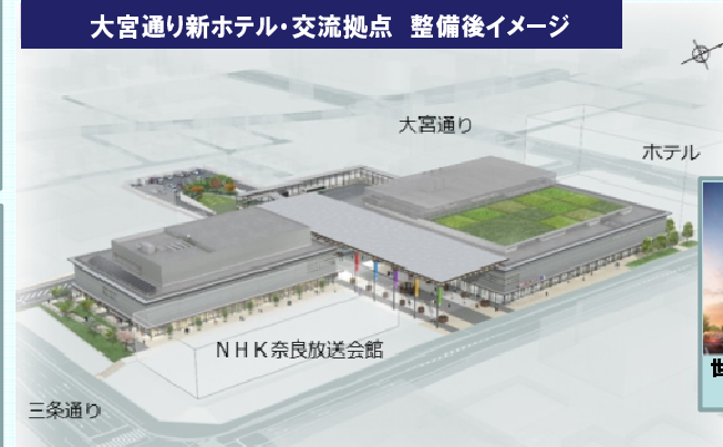
大宮通り新ホテル・交流拠点 整備後イメージ