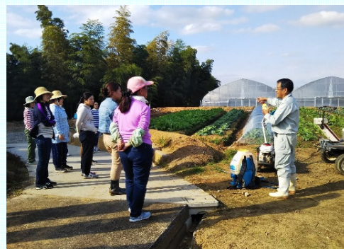
女性のための農業経営セミナー