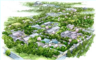
吉城園周辺地区整備後のイメージ