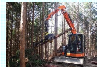
奈良型作業道と高性能林業機械を 組み合わせた木材生産の現場