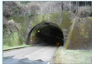
国道370号水谷トンネル(吉野町)