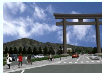
市町村連携によるまちづくり(三輪地区) 県道三輪山線整備イメージ(桜井市)