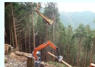
作業道整備や高性能機械の導入