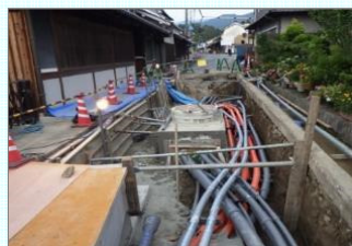
県道檀原神宮東口停車場飛鳥線(明日香村)