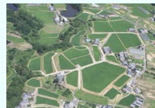
ほ場整備(五條市山陰地区)