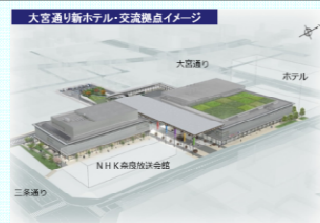
大宮通り新ホテル・交流拠点の完成イメージ