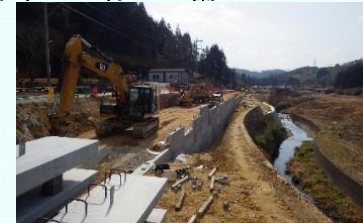
馬佐～新野工区の進捗状況(大淀町)