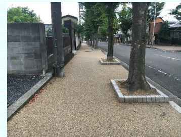
歩道の段差解消 県道奈良名張線(奈良市)