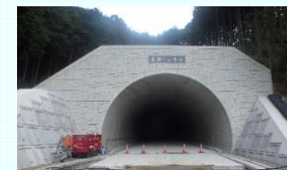
(仮称)清水谷トンネルの進捗状況(高取町)