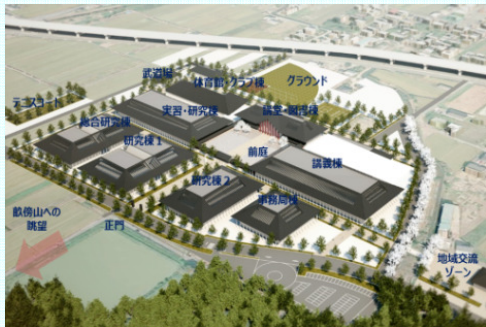
新キャンパスのイメージ