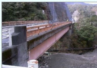
国道168号池穴小橋(十津川村)