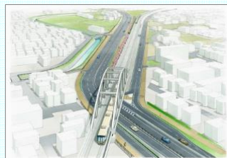
(都)西九条佐保線の完成イメージ