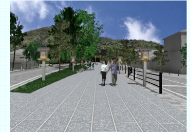
道路の無電柱化 県道三輪山線(桜井市)