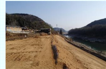
阿田工区の進捗状況(五條市)