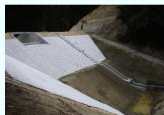
ため池整備 (葛城市野田谷地区)