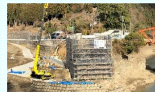
(仮称)新阪本橋の進捗状況(五條市)