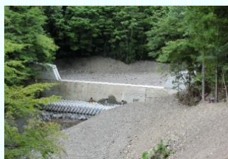
十津川村杉清小井谷地区