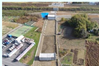
天理王寺線長楽工区の整備状況 (川西町～河合町)