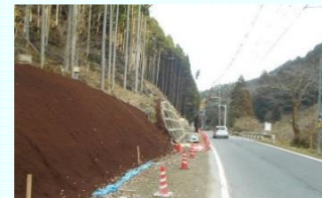
小川～鷺家工区の進捗状況(東吉野村)