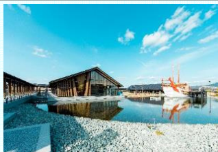
完成した平城宮跡歴史公園 朱雀大路西側地区