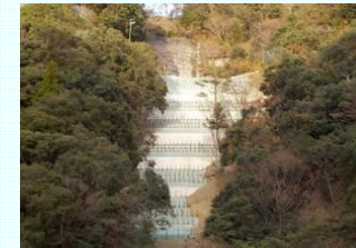
下北山村上池原地区