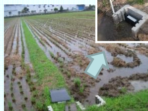
水田貯留 (田原本町阿部田地区)