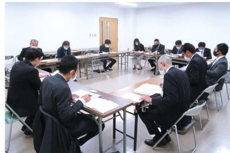
▲第20回路線別検討会議(中部E1グループ)