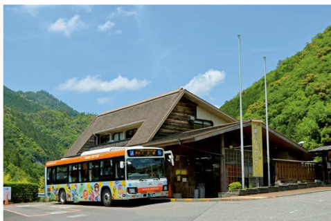
▲支援を実施するバス路線八木新宮線(奈良交通(株)運行) 大和八木駅(橿原市)～新宮駅(和歌山県新宮市)

バスによる公共交通ネットワークを維持・確保するため、市町村を跨ぐ基幹的なバス路線や、市町村等が運営するコミュニティバス等に対して支援しています。