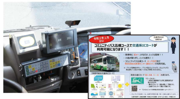
▲市町村コミュニティバスに整備されたICカード決済器(五條市)