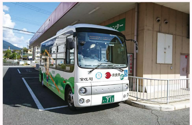
▲五條・十津川地域連携コミュニティバス

これからも、地域の公共交通がよりよいものとなるよう、市町村と連携・協力し、取り組んでいきます。