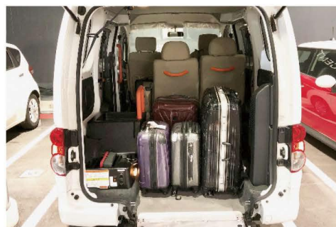
▲ユニバーサルデザインタクシー▲