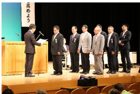
交通安全校両者・団体表彰