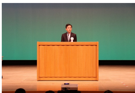
村井副知事による主催者挨拶