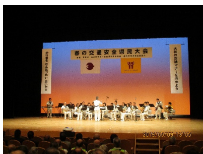
警察音楽隊によるウェルカム演奏

当日は、奈良県警察音楽隊によるウェルカム演奏からはじまり、第1部では、主催者・来賓挨拶、交通安全功労者・団体の表彰、交通安全宣言を行いました。