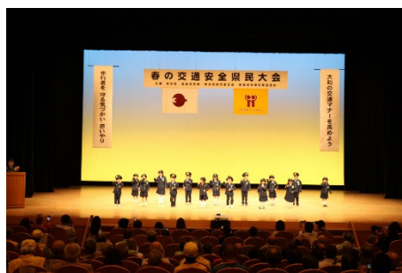
チーム『キッズポリス』によるダンス