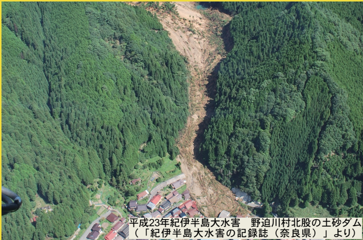
平成23年紀伊半島大水害 野迫川村北股の土砂ダム (「紀伊半島大水害の記録誌 (奈良県)」より)