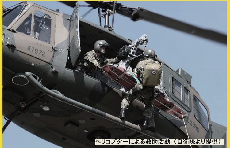
ヘリコプターによる救助活動