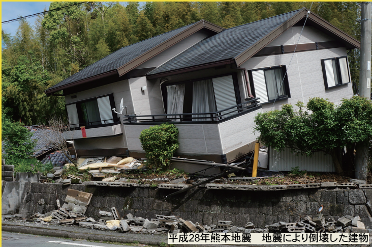
平成28年熊本地震 地震により倒壊した建物

南海トラフ地震や台風、集中豪雨に伴う災害等は、いつ、どこで発生するかわかりません。大規模地震災害・風水害への備えや、災害時の救助活動について、気象予報士・自衛官の視点から講演していただき、県民の防災意識の向上を図ります。