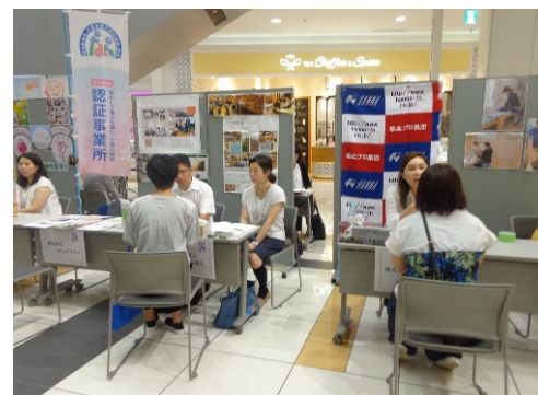
企業ブースでの相談

イオンモール大和郡山北小路コートにて、再就職を希望される女性を対象とした「再就職支援セミナー＆相談会」を実施しました。企業ブースには 9企業 にご参加いただき、PRの場や個別相談を実施しました。