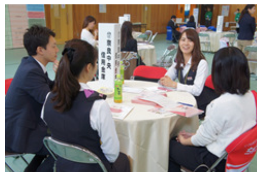
企業テーブルでの交流