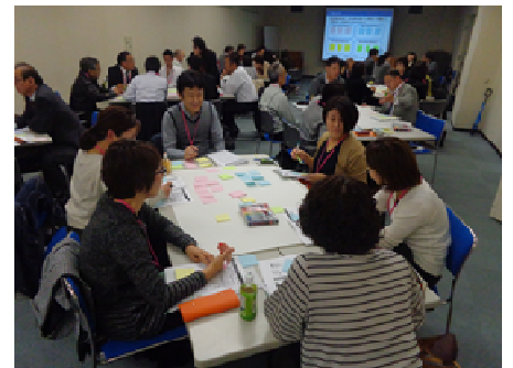
経営者・管理職対象セミナー