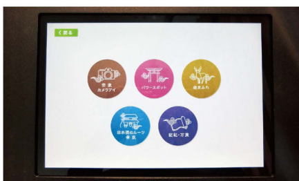
「奈良ストーリー」画面