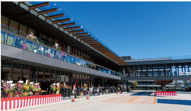
みやげ物店等が入った西棟