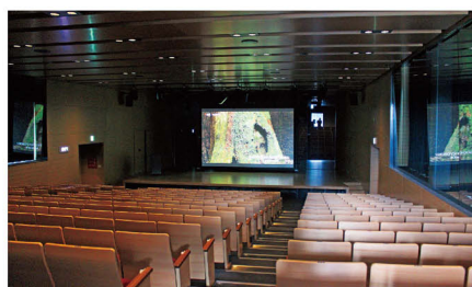
レクチャーホール