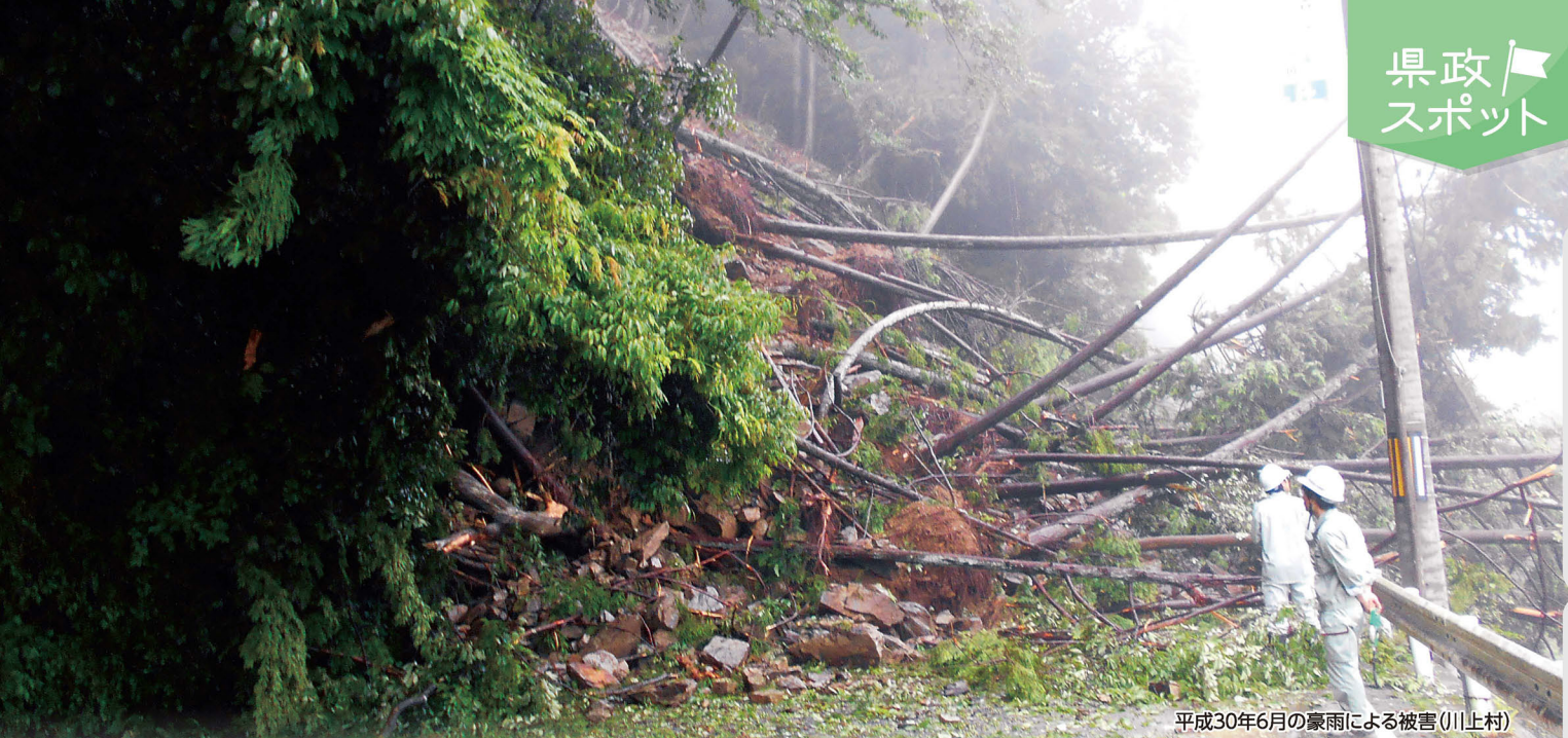
平成30年6月の豪雨による被害(川上村)