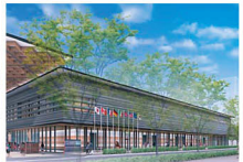
奈良県コンベンションセンター (完成イメージ)

答 4月の統一地方選挙を念頭に置き、いわゆる骨格予算とした。これまでの取組の成果はあがっているものの、課題は山積しており、経済活性化、医療・介護・福祉の充実、観光振興など、各分野の取組をさらに進展させていく必要がある。特に戦後ベッドタウンとして発展してきた本県をもっと良くするためには、将来の発展につながる投資が不可欠であり、「大宮通り新ホテル・交流拠点整備」など、すでに着手しているプロジェクトの着実な進捗を図っていく。また、財政運営の観点からは、将来の県民負担となる県債残高の削減に努め、自前の財源で償還しなければならない残高を平成30年度から86億円減らすことができた。