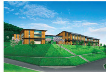
なら食と農の魅力創造国際大学校

答 NAFICの教育機能等をさらに高めるため、令和3年度の完成を目指して、セミナーハウスの整備を進めている。セミナーハウスでは「食」と「農」に関する各種セミナーや研修会の開催を考えている。またNAFIC周辺では、地域食材の魅力を発信するイベントや農業体験、最新の農業技術研修などの取組により賑わいの創出を進める予定。現在、地元との協議を進めているほか、賑わいづくりの中核を担う組織の立ち上げに向け、構成メンバーや役割分担を検討している。