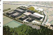
奈良県立医科大学新キャンパス(整備イメージ)

答 これまでに策定した大学の将来像や、藤原京をモチーフとしたキャンパス整備イメージを踏まえ、先行整備部分として、医学科の教養教育部門と看護学科の施設整備に取り組んでいる。平成30年度は、施設の具体的な配置計画や必要な機能などを検討し、基本計画として取りまとめるとともに、都市計画決定に向け、関係機関と事前協議などを進めている。令和元年度は、都市計画決定手続きを進めるほか、文化財発掘調査などを行い、その後、各種設計、土地造成、建築工事等を順次進めていく。