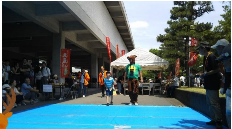
去年の大会の様子