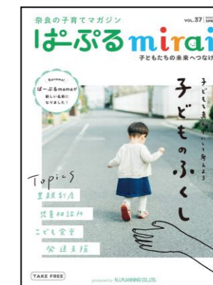
フリーペーパー「ぱーふるmirai」