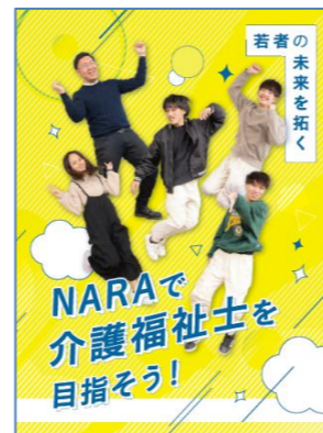
「NARAで介護福祉士を目指そう」