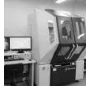
多目的X線回折装置

さらに、材料試験機による機械的な強度試験、疲労試験、塩水噴霧試験を実施するほか、マイクロビッカースなどの硬さ試験による品質管理の支援も行っています。