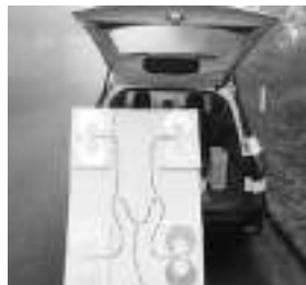
ハーベスティング実験

またこのほか、生活空間に存在するエネルギーの利用技術として、放送電波などの微弱な電磁波のエネルギーを回収して利用するハーベスティングの実験も行っています。