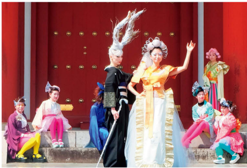
天平ガールズコレクション