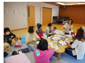
(育児サークルの様子)