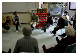
(高齢者体操教室の様子)

【上北山村】 保健福祉課 電話 07468-3-0380 (村HPアドレス) http://vill.kamikitayama.nara.jp/