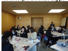
(2～3年目先輩保健師交流会)