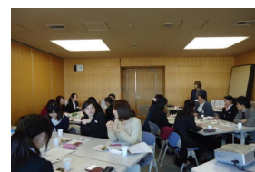
(2~3年目先輩保健師交流会)