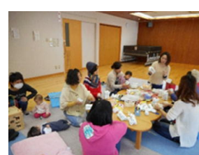
(育児サークルの様子)