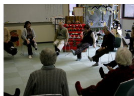
(高齢者体操教室の様子)

(村HPアドレス) http://vill.kamikitayama.nara.jp/