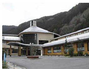
(保健福祉総合センター)

(村HPアドレス) https://www.vill.tenkawa.nara.jp