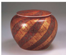
赤地金銀彩羊歯模様 蓋付鉢 昭和28(1953)年 当館蔵

●当館学芸員によるギャラリートーク 申込不要・要観覧券 8/3(土)・17(土)・31(土) 14時～15時