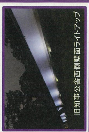
旧知事公舎西側壁面ライトアップ