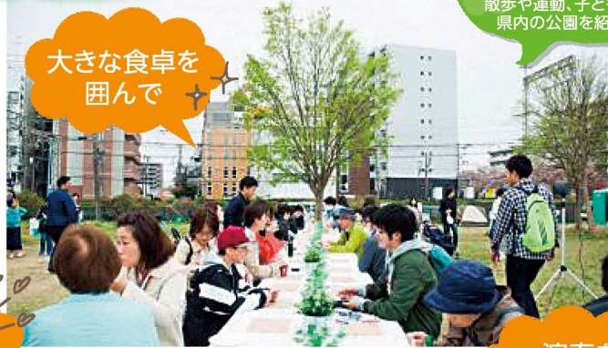
大きな食卓を 囲んで

この緑地では、今年4月より定期的に新たなコミュニティの形成とにぎわいを創出する社会実験イベント「まちの食卓」が開催されています。まちの住民を1つの大きな家族と考え、公園内に大きな食卓を設置し、知らない人同士が1つの食卓を囲むというものです。飲食ブースや子どものお絵かきコーナー、アーティストの演奏などもあります。気軽にお立ち寄りください。