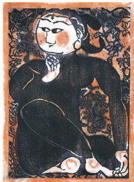
棟方志功「鐘溪頌」全24点のうち「優秘」雪梁舎美術館寄託

■特別展 マンガで語る古代大和Ⅱ 里中満智子『天上の虹』にみる 持統天皇誕生の物語 開催中～9/23(祝)