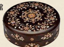
らでんのはこ 螺鈿箱