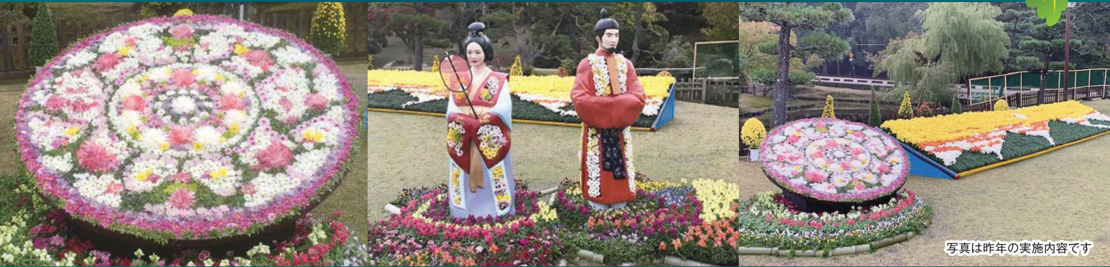
写真は昨年の実施内容です