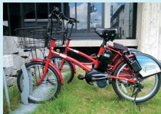
NTTDコモバイクシェア

地域内に複数のサイクルポートを設置し、どのポートでも自転車の借受・返却が可能なシェアサイクル。24時間利用可能な、都市の新たな移動手段として世界各地で普及が進んでいます。奈良市内でも「NTTDコモバイクシェア」と「モバイク」がサービスを提供しています。