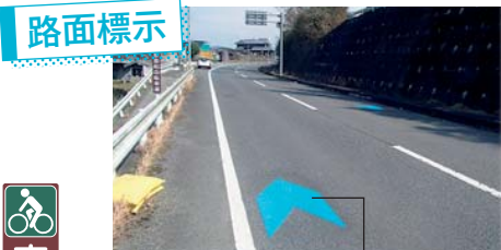
矢羽根部分は自転車の走行位置を示しています。