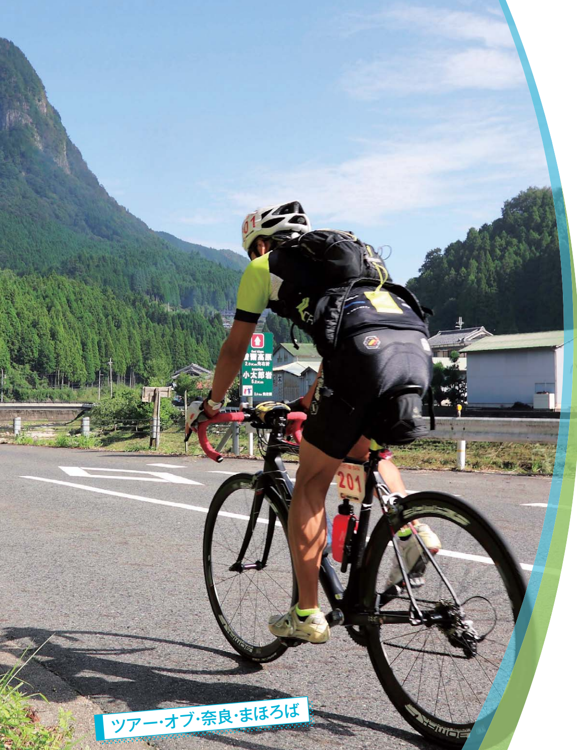
ツアー・オブ・奈良・まほろば