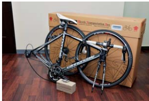
搬送サービス取次