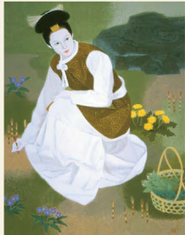
室井兼志生「春野」(万葉文化館蔵)

県立万葉文化館のコレクション「万葉日本画」が季節を彩る美しいカレンダー。題材となった歌と解説もあり、郵送やギフトに使える封筒付き。1部800円(税込)