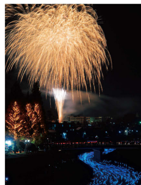
天の川プロジェクト®

所 王寺小学校グラウンド特設会場(王寺町本町)ほか 問 王寺ミルキーウェイ実行委員会 (王寺町政策推進課内) ☎0745-73-2001