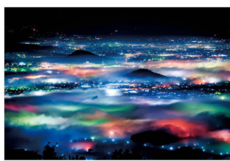
天理市長賞作品(2017年)

「天理・山の辺の道の魅力を再発見!」をテーマに、天理と山の辺の道のおすすめスポットの写真を募集します。入賞作品は観光宣伝等に使用されます。詳しくは下記HPへ。2/28 締切。