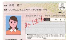
マイナンバーカード(見本)

他の質問項目 ●医師・看護師の確保●今後のまちづくり●市町村財政と奈良モデル●企業誘致●大規模広域防災拠点の早期整備と陸上自衛隊駐屯地の誘致実現