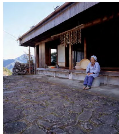
居住於果無集落的巖本老人