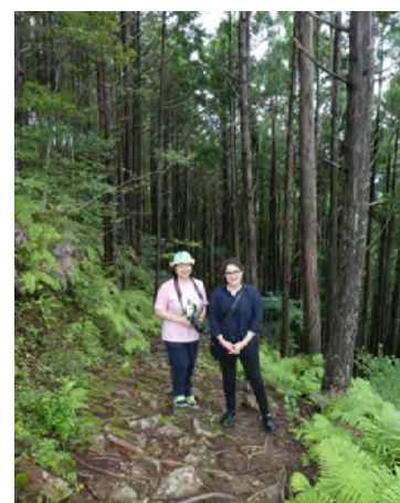
於世界遺產熊野古道之小邊路