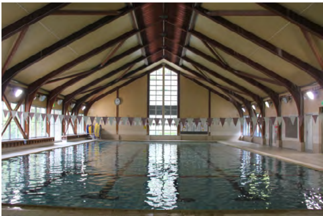
酒店“昴”的溫泉泳池

每年 8 月中旬，酒店前的廣場上會舉辦由十津川村內 4 個舞蹈團體組織的夏季大型傳統舞蹈聯歡活動。借用奈良女子大學武藤康弘教授的話：““十津川的大型傳統舞蹈由於很好地傳承了近代風流舞蹈（穿特色服裝隨樂曲而跳的一種群眾性舞蹈，流行於日本 14-16 世紀）的特征，而於 1979 年被指定為國家重要非物質文化遺產。”獲得了高度評價。