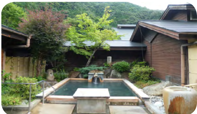
酒店“昴”的一個室外溫泉