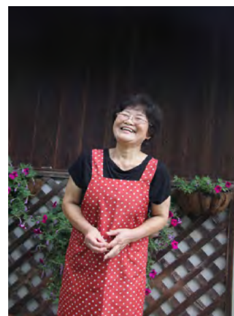
堅強面對災害的中南女士的 開懷大笑，令我無法忘懷。

說到 8 年前紀伊半島大水災的情形，當時災害所累、停水斷電若幹天，交通癱瘓、手機都沒有信號。從那種重災中復興、今天滿面笑容地為遊客提供完善的民宿服務，使人不由得心生佩服。