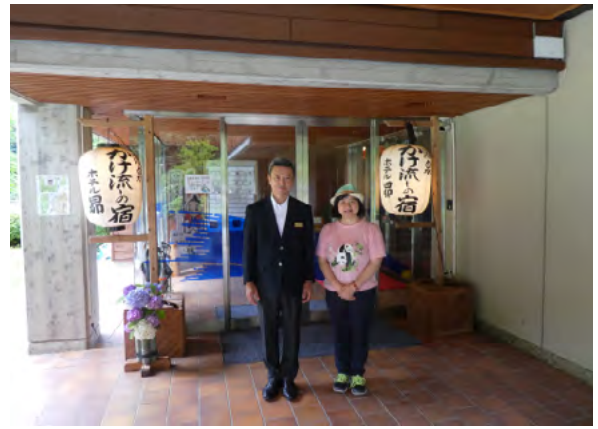
酒店“昴”的三浦總經理與筆者（酒店大門前）

☆ 過去五年來外國遊客增加了 6 倍，為了能與外國遊客順暢交流，酒店專門配置了翻譯機。