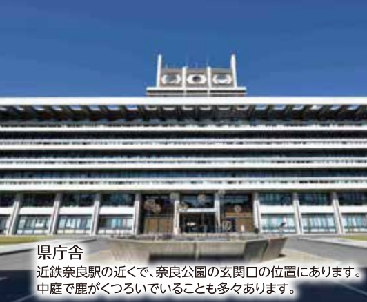
県庁舎 近鉄奈良駅の近くで、奈良公園の玄関口の位置にあります。中庭で鹿がくつろいでいることも多々あります。