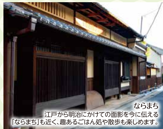
ならまち 江戸から明治にかけての面影を今に伝える「ならまち」も近く、趣あるごはん処や散歩も楽しめます。