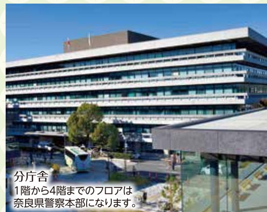
分庁舎 1階から4階までのフロアは奈良県警察本部になります。