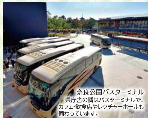
奈良公園バスターミナル 県庁舎の隣はバスターミナルで、カフェ・飲食店やレクチャーホールも備わっています。