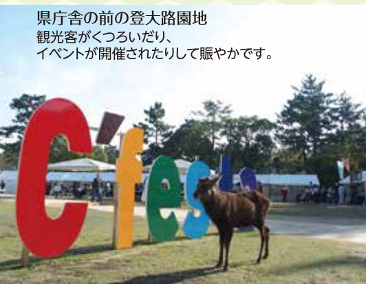
県庁舎の前の登大路園地 観光客がくつろいだり、イベントが開催されたりして賑やかです。