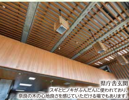
県庁舎玄関 スギとヒノキがふんだんに使われており、奈良の木の心地良さを感じていただける場でもあります。