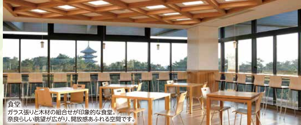
食堂 ガラス張り木材の組合せが印象的な食堂。奈良らしい眺望が広がり、開放感あふれる空間です。