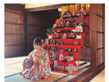
「古民家でひなまつり」