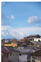
「裏山は古墳」(桜井市御臺古墳)