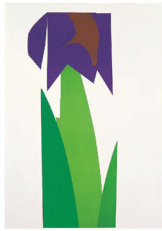
あやめ草 #1 1990年当館蔵

©Ikko Tanaka 1990/ Licensed by DNPpartcom