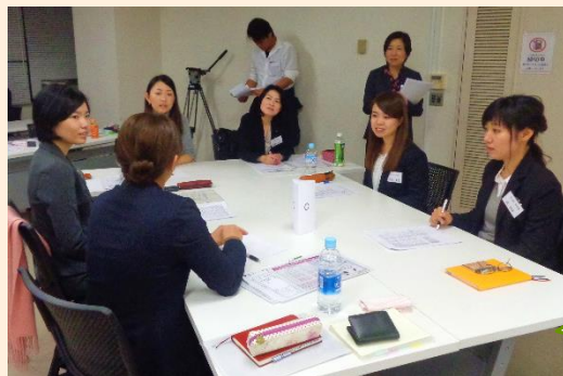
(昨年度の交流会の様子)

昨年度実施し大好評だった、女性限定 異業種交流会を今年度も開催します。 県内の様々な企業の方と、今抱えている課題等を共有し、交流しませんか？