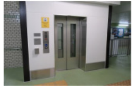
近鉄真菅駅のバリアフリー化(橿原市)