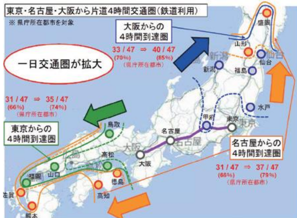
(出典)国土交通省「スーパーメガリージョン構想検討会最終とりまとめ」より抜粋

そうですね。さらに奈良県では、「関西国際空港・リニア中央新幹線接続新幹線」構想の検討を行っています。