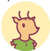
踏切道改良計画の策定件数

道路と鉄道を立体交差化すると、踏切がなくなって、踏切における渋滞が解消されるんだね。