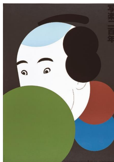
画像：(左)《Nihon Buyo》1981年、(中)《第5回産経観世能》1958年、(右)《写楽二百年》1995年全て奈良県立美術館蔵