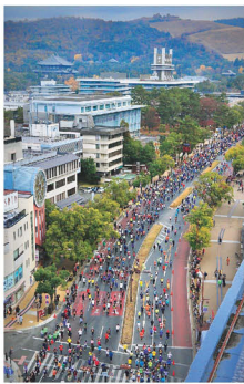
近鉄奈良駅から県庁へ!