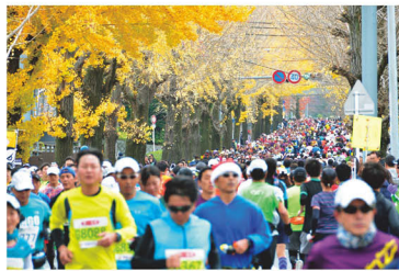
天理の銀杏並木を走るランナー

大会へのエントリーについては6月頃に 大会HPでご案内します。 詳しくは大会HPをご覧ください。