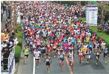
昨年のスタートの様子