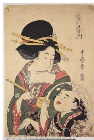
二代喜多川歌麿 「六玉川月窟墨」 文化年間(1804～18) 公文教育研究会蔵

■日本書紀をよむ「崇峻紀・推古紀一聖徳太子伝説」 5/27(水) 14時～ 300円