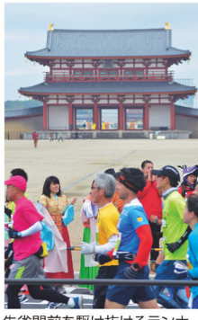
朱雀門前を駆け抜けるランナー