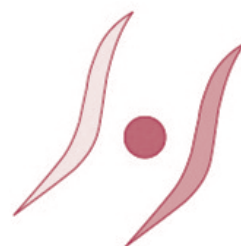
奈良県社員・シャイン 職場づくり推進企業