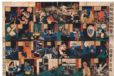
歌川芳興「百種怪談妖物双六」安政5年(1858) 公文教育研究会蔵