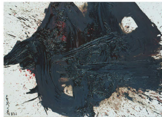
白髪一雄「貞宗」1961年 京都工芸繊維大学美術工芸資料館蔵