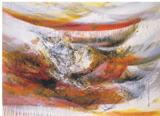
堂本尚郎「無題」1960年 国立国際美術館蔵

「大橋コレクション」は日本現代美術のプライベートコレクションの先駆的存在。戦後昭和に躍動した画家たちの熱いエネルギーを感じてください。