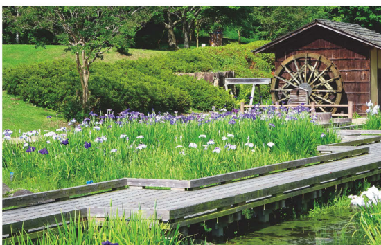
菖蒲咲き誇る大和民俗公園

古民家のある大和民俗公園では、6月中旬から花菖蒲や紫陽花など、初夏を告げる花々が開花します。 ※詳しくはHPまたは電話でお問い合わせください。