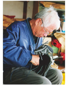
野球グローブひも通し作業