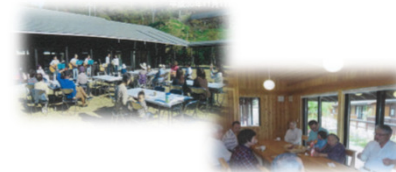
コミュニティ形成・賑わい創出