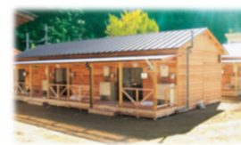
新設やリフォーム