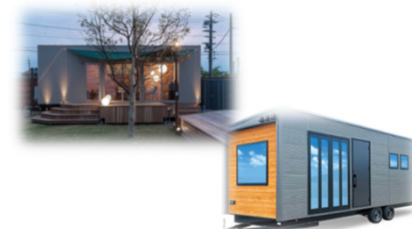
ユニットハウスやトレーラーハウスの購入