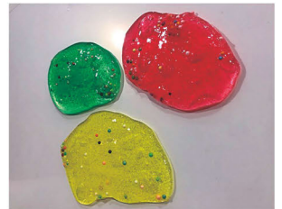
カラーポップスライム

カラーポップスライム工作など、当日限定のイベントを開催! こども科学館の入館料のみで参加できます。詳しくは下記へ。