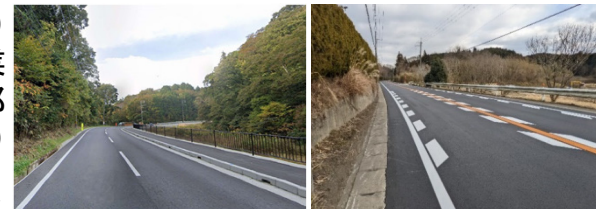
一般国道25号(福住工区) 天理市道上入田都祁線

(名阪国道周辺の道路整備) 一般国道25号道路拡幅事業(奈良県)や市道上入田都祁線の舗装繕繕工事(天理市)等の名阪国道を補完する県道・市道の整備を進めている。