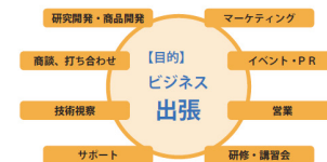
図：ビジネスマンの乗訪目的