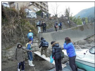
国道通行止め時、ボートによるダム湖内の通学状況