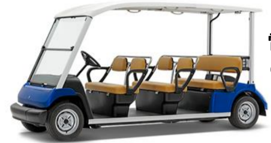
電動カート (定員5名)

乗車料金 ・大人 300円 ・小人(小学生) 100円 ・障がいをお持ちの方 100円