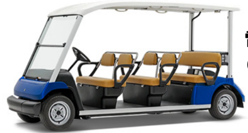
電動カート (定員5名)

乗車料金 ・大人 300円 ・小人(小学生) 100円 ・障がいのある方 100円