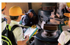
かまど見学の様子

園内の古民家4軒で、炭火アイロンや回転ごたつ、黒電話、あんどんなど約100年前の道具をテーマごとに展示します。 ※イベント開催時は展示物を撤収する場合があります。 ※団体見学は、お問い合わせください。