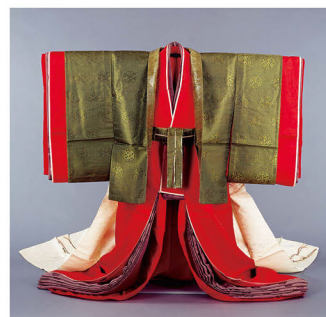
女官装束 大正4年(1915) 京都国立博物館蔵

公家装束は、奈良時代の朝服に由来し平安時代に成立して以来、現代まで受け継がれてきました。本展では、日本の美の真髄である「みやび」の世界を紹介します。