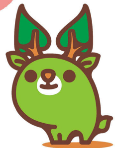
奈良県エコキャラクター な〜らちゃん