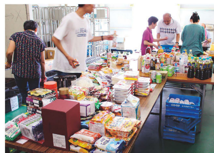
寄付された食品の仕分け作業