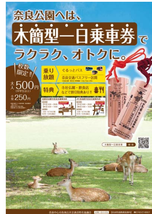
図. 木簡型一日乗車券ポスター（R2年春期）