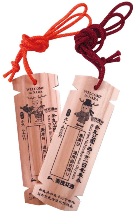
図. 木簡型一日乗車券