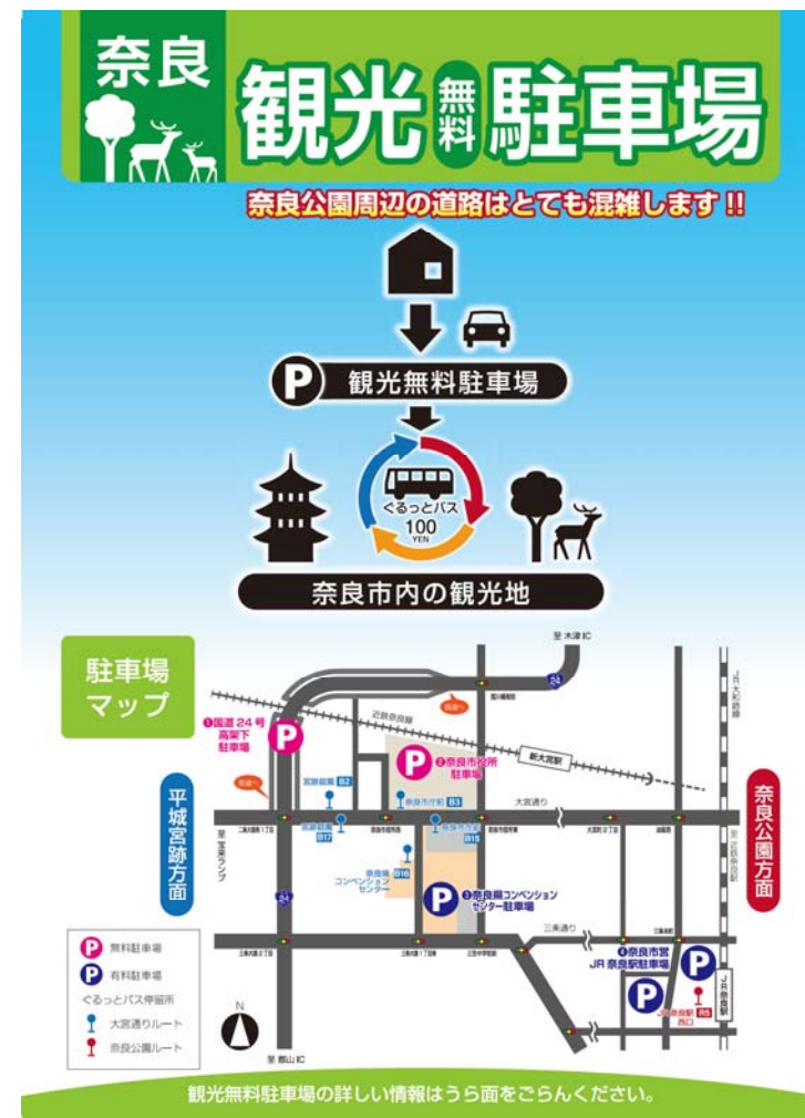
図. P&Rの実施概要 (令和2年春期)