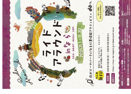
▲（左）「サイクルフォトシェアin奈良」のチラシ ▲（右）「ライドアラウンドinなら」のチラシ