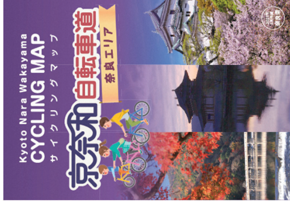
▲京奈和自転車道サイクリングマップ（左） なら自転車遊歩（右）