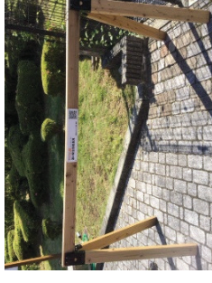
▲「モバイルグランフオンDin奈良・吉野」の開催の様子