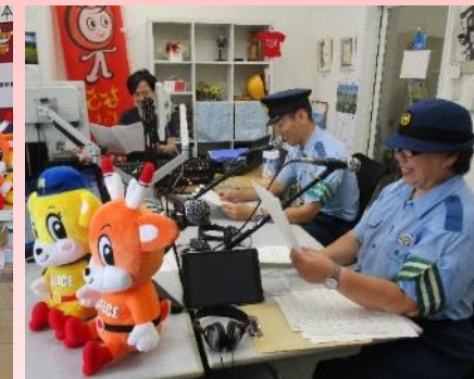
▲ヘルメット着用促進等に向けた交通安全普及啓発活動