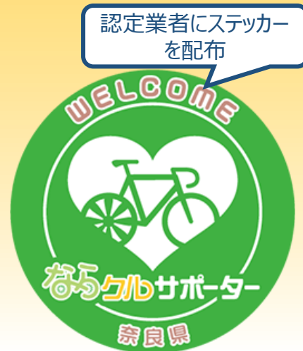
▲ならクル・サポーター認定マーク