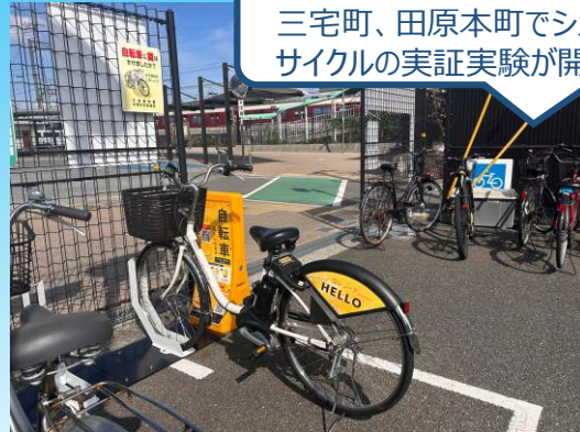
▲石見駅前のサイクルポート