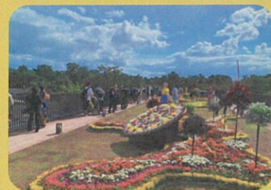
※写真は昨年の実施風景です